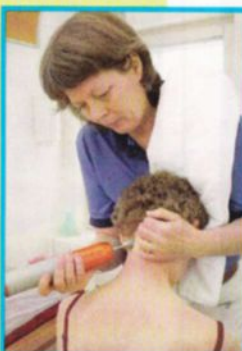
När det är trångt i nacken kan även små förskjutningar skapa stora problem.